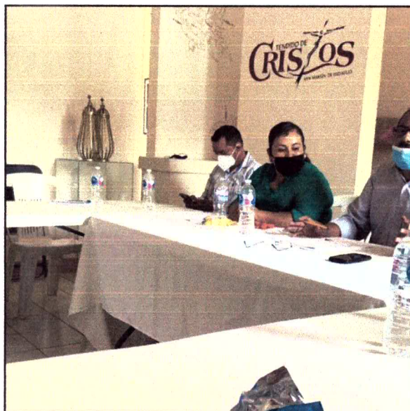
Ilustración 7 Reunión de la Comisión de Ecología, San Martín de Hidalgo, Jalisco.