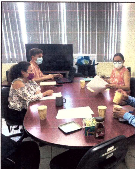
Ilustración 8 Reunión de trabajo con la Dirección de residuos de la SEMADET, Guadalajara, Jalisco.