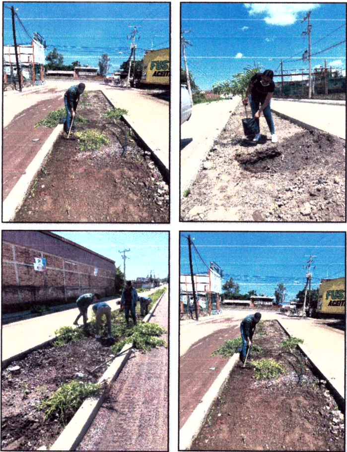
Ilustración 3 Arborización de la calle Jalisco, Cocula, Jalisco 2021