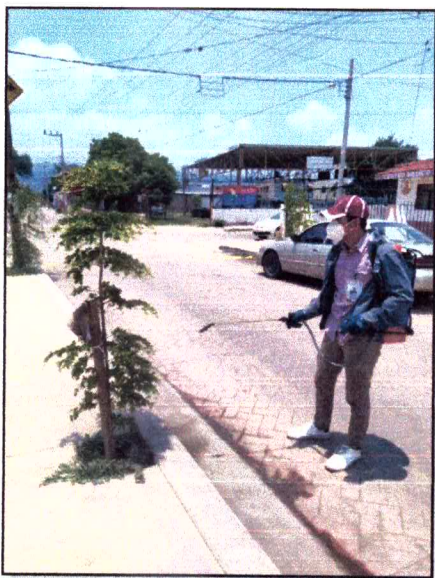
Ilustración 4 Mantenimiento de arborizaciones urbanas, Carretera Barra de Navidad-Guadalajara y C. Ocampo, Cocula, Jalisco 2021