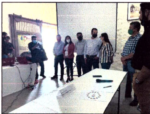
Ilustración 5 Reunión de trabajo del Informe de avance de actividades de la JIMAV, Etzatlán, Jalisco.