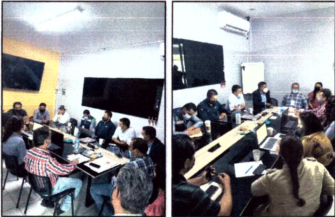
Ilustración 6 Reunión de Trabajo "Campo Limpio", JIMAV y SEMADET, Tala, Jalisco.