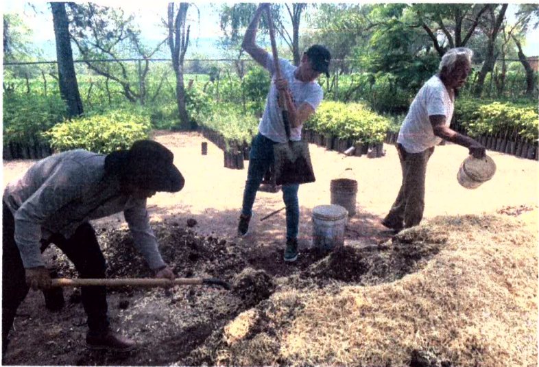
Ilustración 2 Preparación de sustrato, Vivero Municipal.