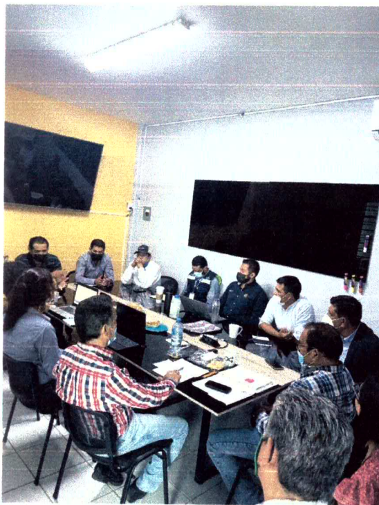
Ilustración 1 Reunión Campo Limpio, JIMAV, Tala, Jalisco